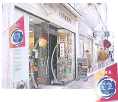
Devanture d'une entreprise engagée dans la Charte Qualité.