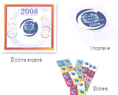
Kit magasin millésime 2008 remis aux entreprises lauréates de la Charte Qualité.