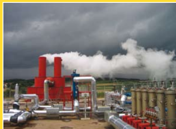
Géothermie à Soultz Sous Forêts