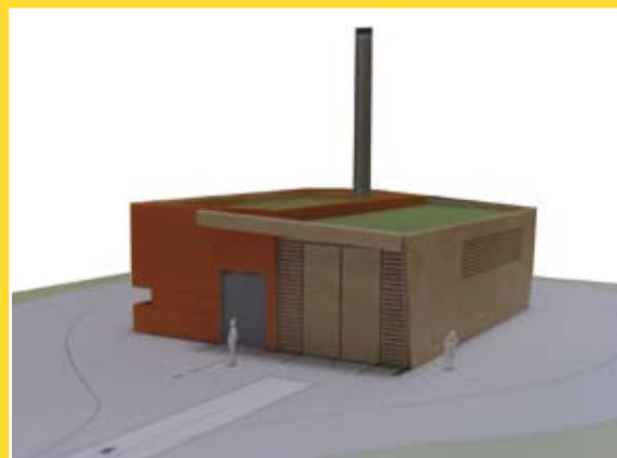
Maquette de la chaufferie bois

Pour concilier performance, économie d'énergie et respect de l'environnement, deux réalisations exemplaires sont actuellement menées sur le territoire. La première consiste à récupérer l'énergie résiduelle de la station géothermique de Soultz-sous-Forêt afin de chauffer des serres agricoles. La seconde, menée à Durrenbach, consiste à valoriser les déchets de la filière bois. Une chaufferie de 1,5 MW (l'équivalent des besoins en chauffage de 100 foyers environ) assurera notamment le chauffage de l'établissement thermal. Cet équipement complémentaire à l'utilisation de la géothermie permettra de valoriser ainsi les déchets bois issus des exploitations forestières locales.