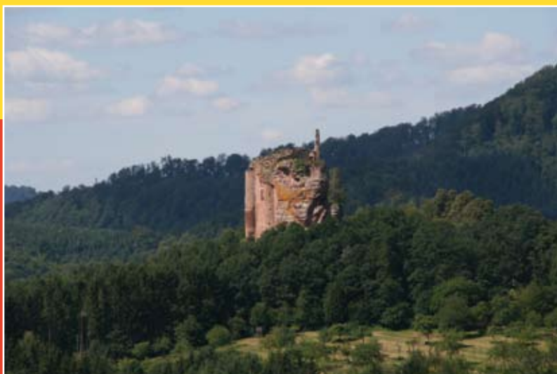
Château de Fleckenstein

Mais si le tourisme constitue un pôle de développement naturel, il ne doit pas être le seul. L'économie classique est stimulée par la création d'un parc économique adossé au ban de Haguenau sur la commune d'Eschbach. Une nouvelle zone d'activité proche de la société Isri devrait également voir le jour pour accueillir des sous-traitants et permettre de nouvelles synergies.