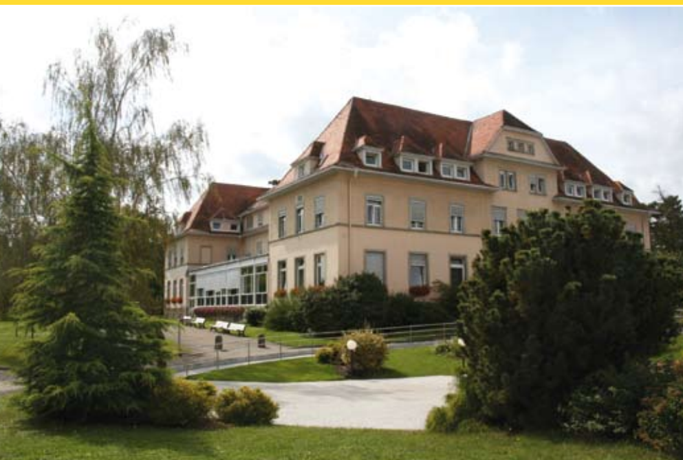
Etablissement thermal de Morsbronn-les-Bains