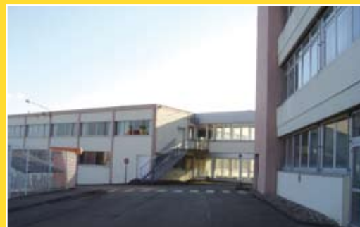
Anciens locaux d'Acean

La France se désindustrialise, et la communauté de communes de Sauer-Pechelbronn ne fait pas exception. Le territoire a perdu en quelques années des entreprises grandes pourvoyeuses d'emplois dont Acean (ex Alcatel). Il reste cependant la société Isri, spécialisée dans la fabrication de sièges pour poids-lourds qui compte 600 salariés.