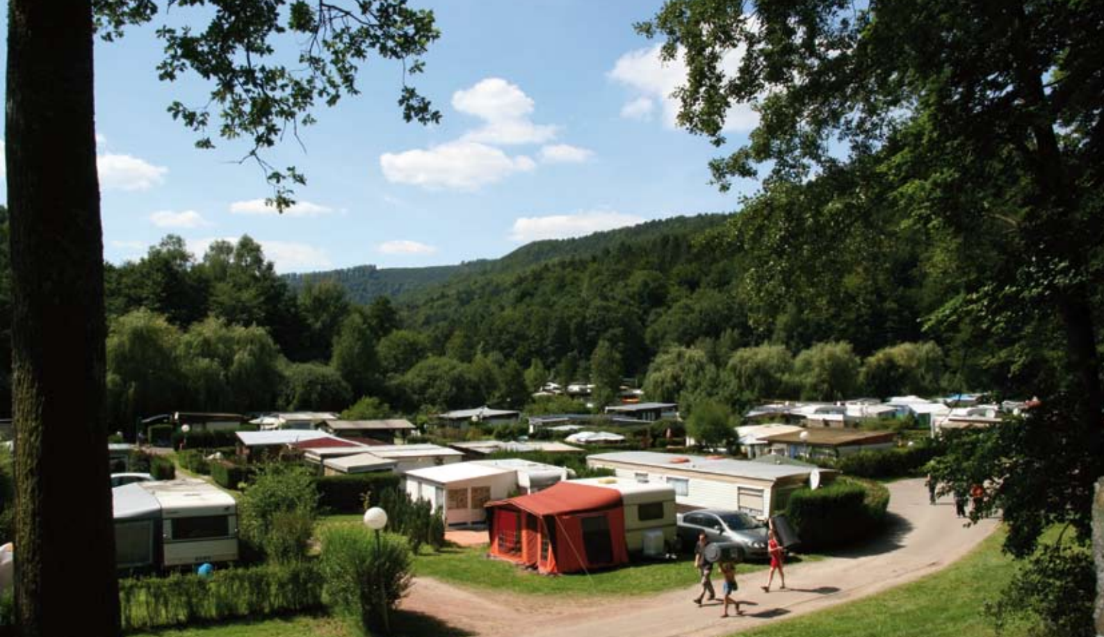
Camping du Fleckenstein