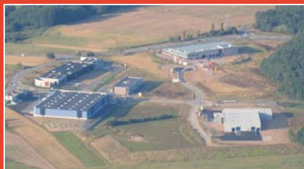
Parc économique de la Sauer