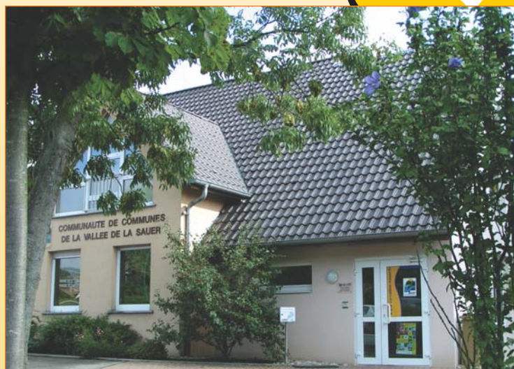
Bureaux actuels de la communauté de communes

Afin d'améliorer la qualité du service et d'optimiser les coûts administratifs, la communauté de communes s'est associée au syndicat des eaux du canton de Woerth pour la construction de locaux partagés qui apporteront entre autre un accueil commun au deux structures, une grande salle de réunion, un point office de tourisme et des salles au service d'associations et d'institutionnels. Un hangar atelier permettra de garer les véhicules et d'entreposer la banque de matériel. L'opération a été budgétisée à hauteur de 2,5 millions d'€.