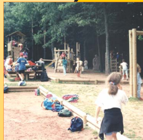
Aire de jeux du Gimbelhof