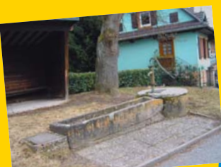
Fontaine à Hoelschloch