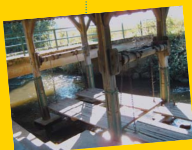
Lavoir à Oberdorf-Spachbach