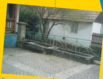
Fontaine à Lampertsloch