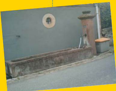
Fontaine à Lampertsloch