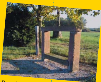
Banc Napoléonien à Durrenbach

(à côté du bâtiment actuel), un espace de vie pour tous !