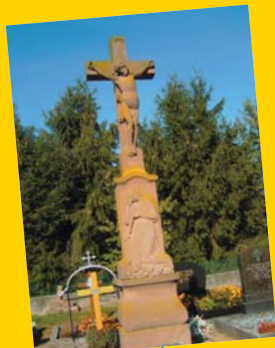
Croix de cimetière à Biblisheim