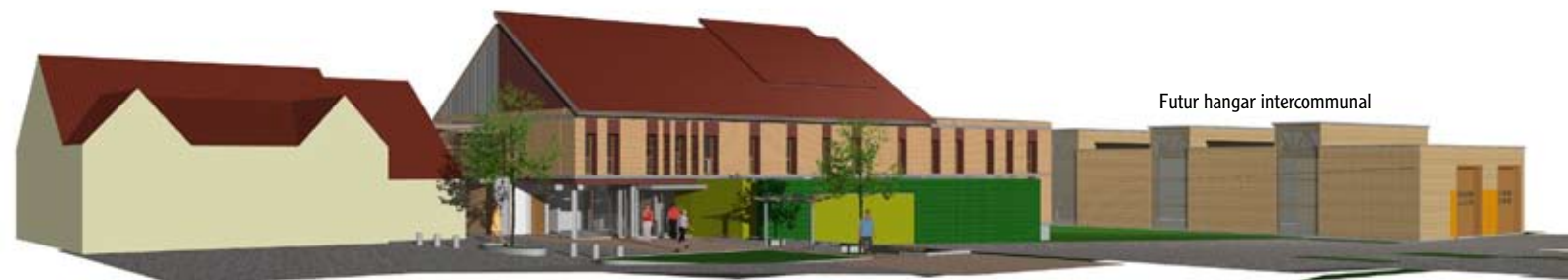
Futur hangar intercommunal

Le budget 2009 est stable par rapport à 2008 et s'élève à 18,5 millions d'euros.