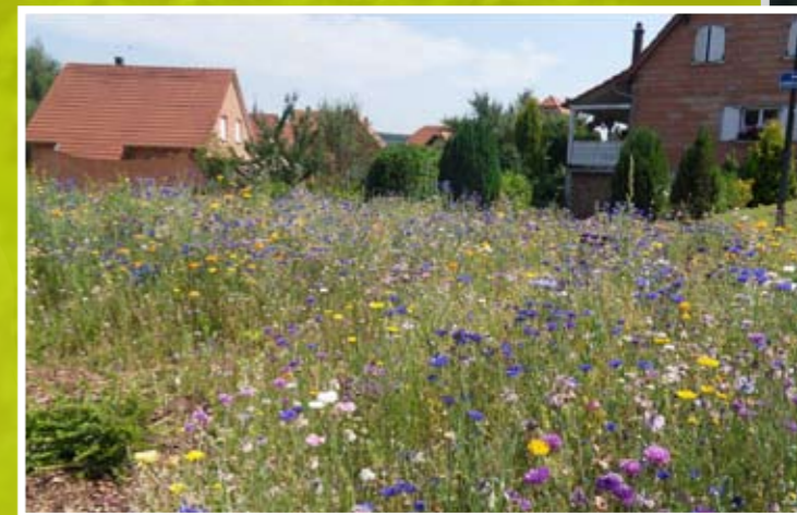
Prairie fleurie à Wingen