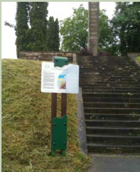
Itinéraire 1870 entre Woerth et Froeschwiller