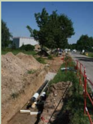
Réseau de chaleur à Morsbronn-les-Bains