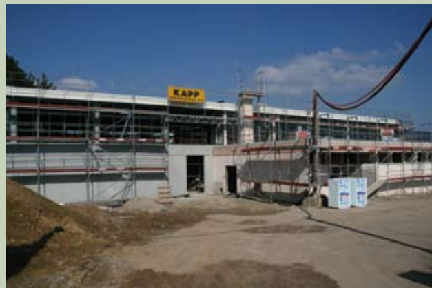
Gymnase intercommunal à Woerth