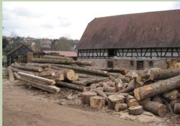
Scierie Ehrstein à Lembach