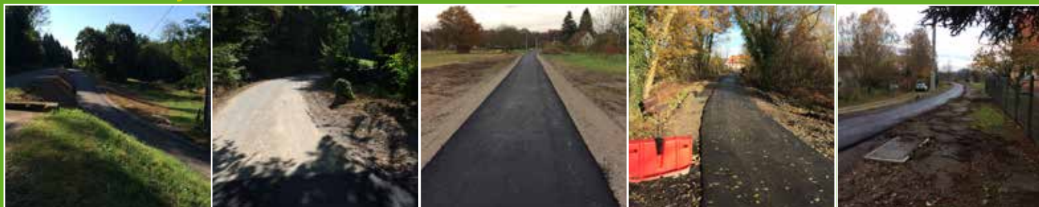
Langensoultzbach - RD27