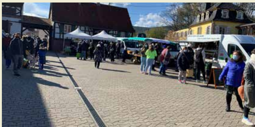
Marché de Lobsann